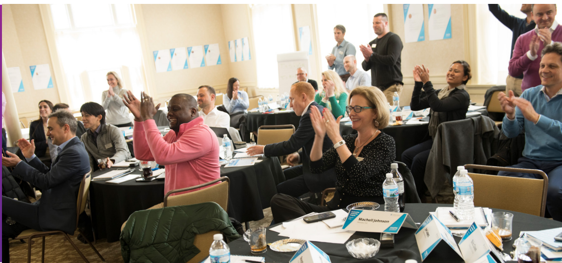
*מתייחס לעובדים במשרה מלאה וחלקית של Zimmer Biomet.

Zimmer Biomet מספקת הזדמנויות צמיחה ופיתוח לחברי צוות באמצעות המשך לימודים.