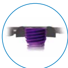
ロックングスクリュー