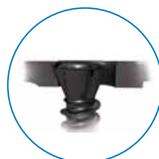
ロープロファイルスクリュー (ノンロックング)