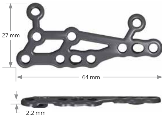
メディアルコラムフュージョン