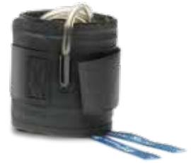
ディスポーザブルカフ

カタログ記載内容は、カタログ作成時点の内容に基づいています。製品の在庫や販売状況に関しては、下記までお問合せください。