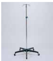
タニケットスタンド

販売名: 滅菌済みカフ 医療機器製造販売届出番号: 13B1X10228SG0011