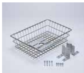
タニケットバスケット