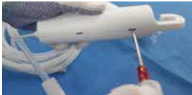
① バッテリーパックの四隅の穴にドライバー等の先端を差し込みます。