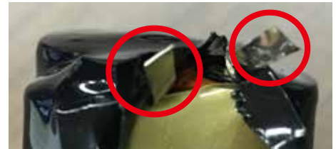
*コードの取り外し後、上図の金具どうしが触れないように注意してください。発火の恐れがあります。金具をテープなどで固定していただくと、より安全に廃棄が可能となります。