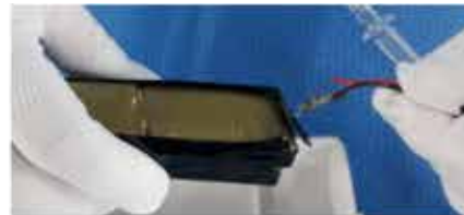
② 引っ張るとコードを取り外すことができます。