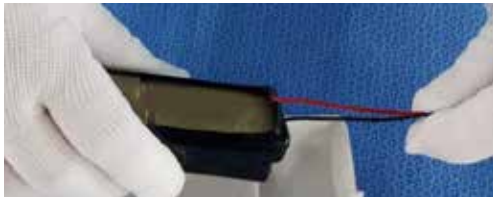
① コードのバッテリー付着部を持ちます。