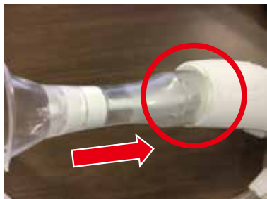
① チップを本体に斜めに差し込みます。