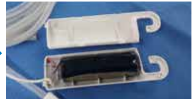
③ バッテリーパック内部のバッテリーを取り出します。