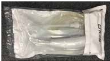
① 箱から取り出します。