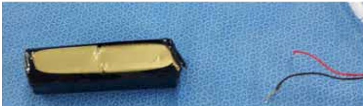
③ コードを取り外したバッテリーを処分してください。 *バッテリーのカバーは破かないようにしてください。 発火の恐れがあります。