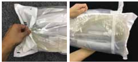
② 白いタイベック部分を持ち、開封します。