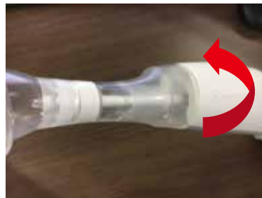
② 回しながら装着します。