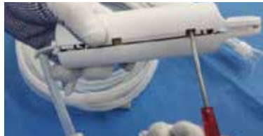
② 差し込んだドライバー等をひねって開けます。