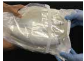
③ 中身は清潔野で受け取ります。