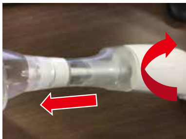
③ 取り外す場合は逆向きに回して引いてください。